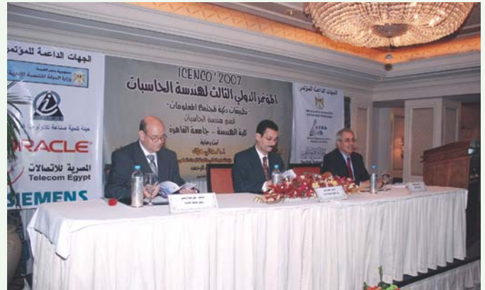
معالى أ.د. أحمد درويش وزير الدولة للتتمية الإدارية فى افتتاح المؤتمر

عقد المؤتمر الدولى الثالث لقسم هندسة الحاسبات خلال الفترة ٢٦-٢٧ ديسمبر ٢٠٠٧ بـ فندق فورسيزون بالجيزة. وقد افتتح المؤتمر معالى الأستاذ الدكتور أحمد درويش وزير الدولة للتتمية الإدارية والأستاذ الدكتور على عبد الرحمن رئيس الجامعة والأستاذ الدكتور سمير شاهين عميد الكلية.