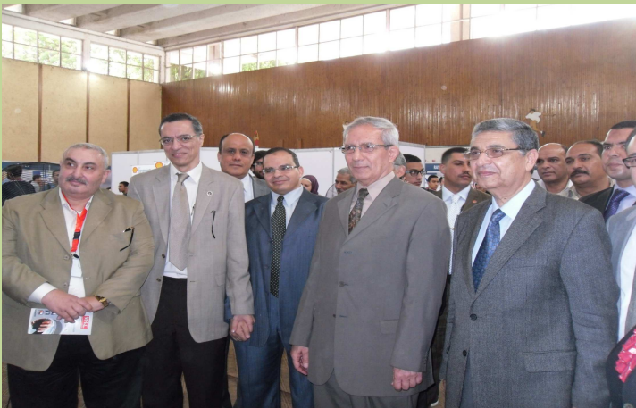
ملتقى تنمية المهارات والتوظيف السنوي