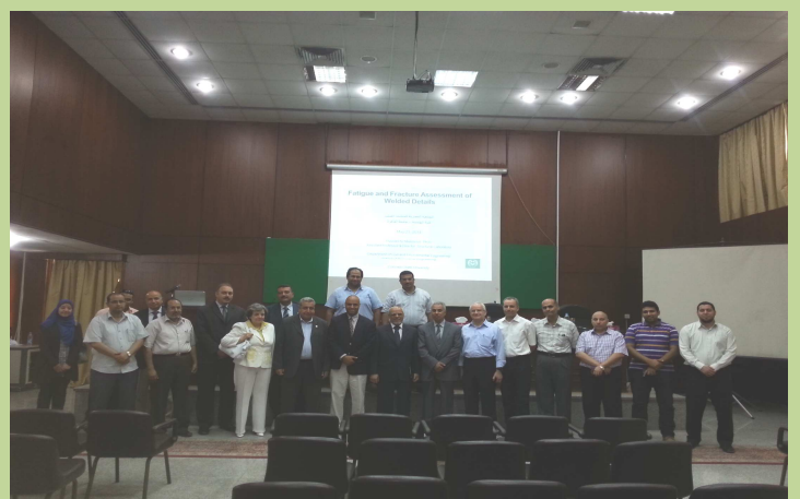
ندوة "Fatigue Assessment of Welded Details"