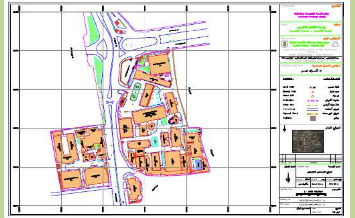
رفع مساحى تفصيلى للكلية