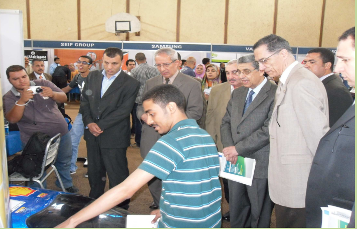
ملتقى تنمية المهارات والتوظيف السنوي