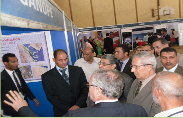
ملتقى تنمية المهارات والتوظيف السنوي