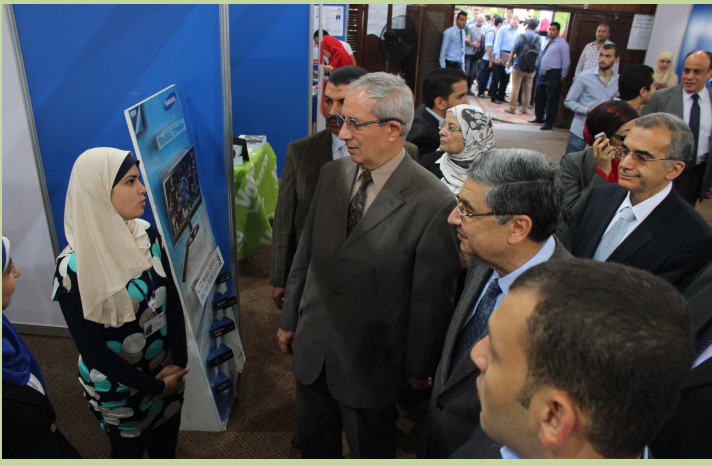
ملتقى تنمية المهارات والتوظيف السنوي